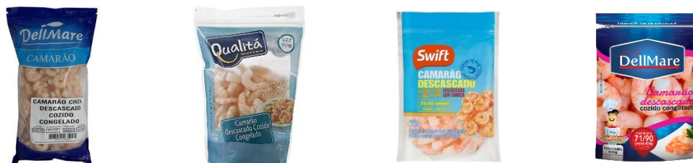
Figura 1: Ejemplos de presentaciones observadas en supermercados locales

Dependiendo el tamaño, el precio de una presentación de 400 gramos varía en un rango de $8 a $20 dólares (tipo de cambio 5BRL x 1USD aproximado).